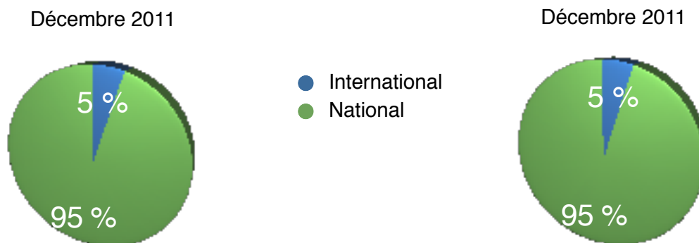
Evolution des mouvements de passagers